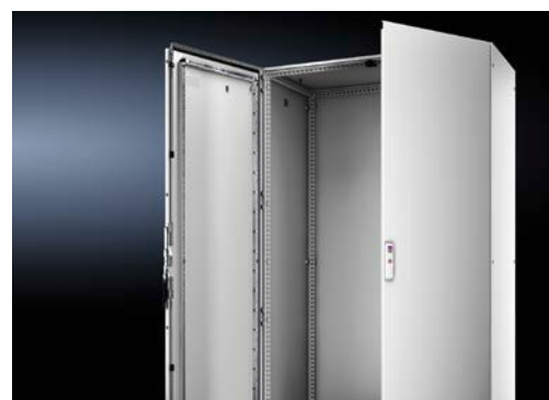
Tavlebyggeren behøver ikke å gjøre tilpasninger i døren for å få 180-graders åpning. Det nye 180-graders hengselet monteres raskt og enkelt uten boring.