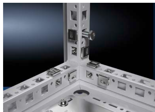
De fleste av de forbedrede funksjonene i Rittals nye store gulvskap VX25 er i ny rammeprofil. Dette gir for eksempel ny tilgjengelighet fra skapets alle fire sider.

Tidsbesparingen gjelder også for montasjeplaten som det når mulig å montere fra baksiden. Dette er en stor fordel, særlig når montasjeplater med tunge komponenter installeres, noe som var vanskelig før. VX25-rammens ekstra installasjonsdybde gir også en mulighet til å montere montasjeplaten ytterligere 20 mm dypere inn i skapet, da den nye formen på rammesystemet tillater dette. Mange kunder som har hatt problemer med å få plass til f.eks. dype frekvensomformere i 600 mm dype skap får nå denne ekstra installasjonsdybden i VX25 og slipper å bruke 800 mm dype skap.