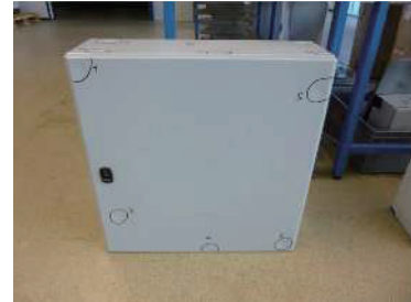
示图3：测试实验室中的机柜

此外，碰撞必须均匀施加在机柜上。换句话说，严禁随意碰撞被测区域，必须遵循一定的对称性。