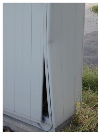
示图1： 碰撞后变形的机柜

然而，在实验室测试中，可能无法在机柜的部位上验证机柜的抗碰撞能力 – 相反，这可能只适用于明确的测试部位。实际上，实现高IK代码的关键部位往往没有经过测试。IK代码可能会根据制造商对质量的理解以及他们自己使用的标准而发生变化。以下章节提供了IK代码的基本信息，IEC 62 262标准的说明，以及对IK代码测试和Rittal（威图）公司目前在Herborn（赫博恩）测试实践的深入了解。