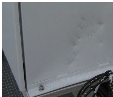
示图2：机柜上的碰撞

然而，当进行IK代码的实验室测试时，不仅需要考虑标准中规定的环境条件，而且还要考虑标准允许的试验范围。