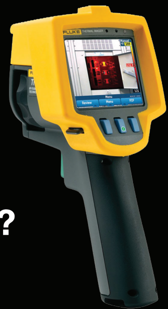
Az elemzést Fluke Ti25 hőkamerával végezzük.