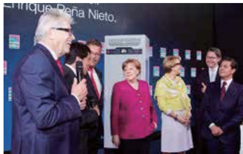
メルケル首相（中央）とペニャニエト大統領（最右）

世界最大級の産業見本市：ハノーバー・メッセ2018（ドイツ 4月23日(月)～27日(金)）に、リタル本社（ドイツ）が出展しました。ブースでは、新型エンクロージャーVX25を主軸とし、新製品を多数出展、国内外問わず多数のお客様にご来場をいただきました。会期初日にはドイツ メルケル首相と、ハノーバー・メッセ2018のパートナー国であるメキシコのペニャニエト大統領にもお越しいただき、メルケル首相は今回で5回目のリタルブース来場となりました。ブースで発表をした新製品VX25の詳細は、後日ホームページやカタログ等でご案内します。