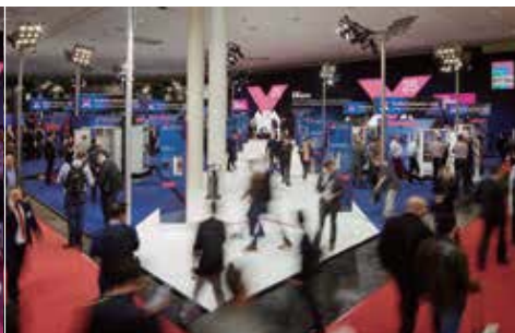
2,300m 2 という大規模ブースで出展