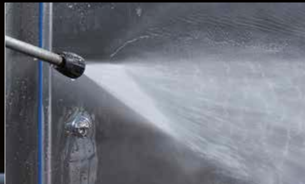
高圧・蒸気噴射洗浄に対応