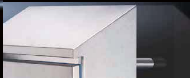
30°の前方傾斜がある屋根(左上)と壁面取り付け用スペーサー(右)

ハイジエニックデザインという言葉、耳慣れない方も多くかもしれませんが、Hygienic=衛生面を考慮して設計された製品のことを指します。衛生面が最重視される食品・薬品産業の生産現場等に利用されています。