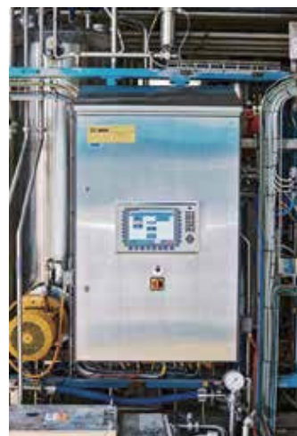
ネスレPTCで使われているリタールのハイジエニックデザイン

そして最もわかりやすいポイントとしては、筐体の屋根部分が30°の前方傾斜型になっており、液体をすぐに流し落とすことができ、汚れや洗浄液が滞留しません。更に壁面取り付け用のスペーサーを使い壁面との隙間をつくることで、筐体の背面パネルも洗浄できます。