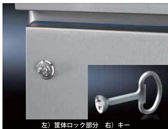
左) 筐体ロック部分 右) キー

リタルの製品を知り尽くしたPMが、マニアックなこだわりを持った製品をご紹介します