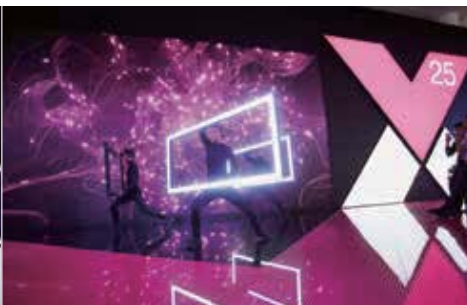
新製品VX25発表にあたり、ブース内で行われたプロジェクションマッピングとダンスのパフォーマンス