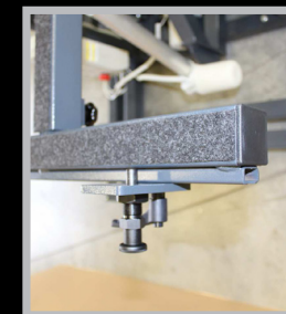
4050.214 Fixações de base