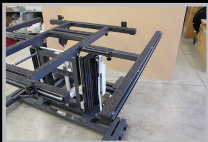
4050.210 Braço extensível