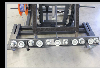
4050.220 Rodízios de movimento

Rittal Portugal - Zona Industrial de Rio Meão - Rua 8, N° 228, 4520-475 Rio Meão - Sta. Maria da Feira Tel: + 351 256 780 210 - Fax: + 351 256 780 219 - E-mail: info@rittal.pt - www.rittal.pt