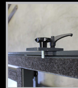
4050.213 Fixações superiores