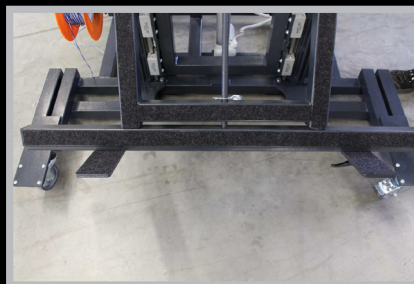
4050.211 Suporte de fixação