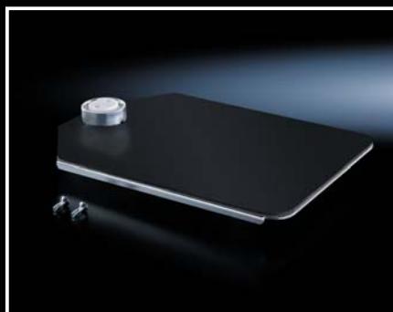
■ Ablage fur Mousepad, schwenkbar