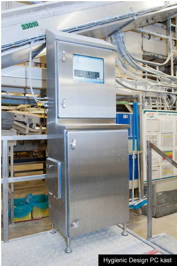
Hygienic Design PC kast

Het is een bekende uitspraak in managementkringen: wie de betrokkenheid van medewerkers wil meten, die controleert of de veiligheidsrichtlijnen worden opgevolgd. In het slechtste geval lapt iedereen ze aan de laars en in het beste geval durven medewerkers elkaar op wederzijdse overtredingen te wijzen. Het laatste is bij Cloetta het geval. Schouten: "In onze productieomgevingen staat de veiligheid van onze medewerkers en consumenten voorop. Ook de voedselveiligheid maakt hier deel uit van een strikt veiligheidsprotocol, dus de productieomstandigheden worden streng gecontroleerd. Dit alles resulteert in een optimale hygiëne en hoogwaardige producten die bovenal heel erg lekker zijn."