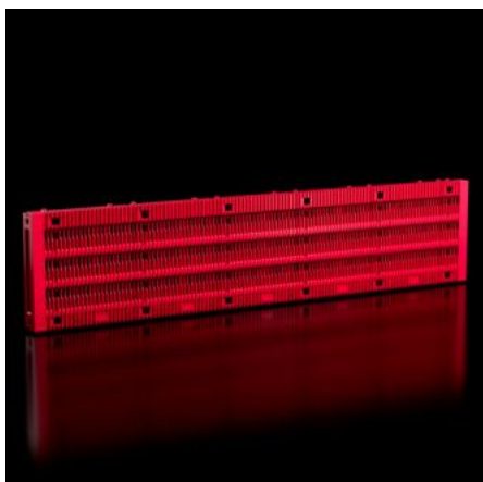
Tableau complet RiLineX tripolaire 800 A avec jeu de barres 30x10 mm intégré. Longueur 1105 mm pour armoires électriques d'une largeur de 1200 mm. Avec protection totale contre les contacts jusqu'à IP 2XB, extension possible jusqu'à IP 3X. Montage possible horizontalement, verticalement et sous le toit. Pour tension jusqu'à 1000 V AC et 1500 V DC. Résistance aux courts-circuits certifiée jusqu'à 65 kA. Guidage des câbles possible à l'arrière. Homologations CEI et UL.