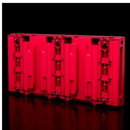
Tableau complet RiLineX 800 A avec jeu de barres 30x10 mm intégré. Longueur 505 mm pour armoires électriques d'une largeur de 600 mm. Avec protection totale contre les contacts jusqu'à IP 2XB, extension possible jusqu'à IP 3X. Montage possible horizontalement, verticalement et sous le toit. Pour tension jusqu'à 1000 V AC et 1500 V DC. Résistance aux courts-circuits certifiée jusqu'à 65 kA. Guidage des câbles possible à l'arrière. Homologations CEI et UL.